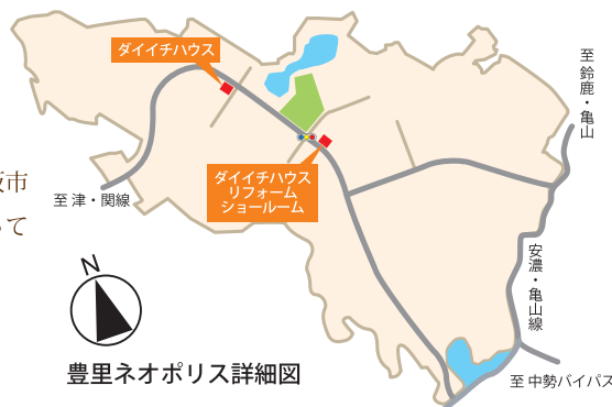
豊里ネオポリス詳細図

私たちダイイチハウスは、「豊里ネオポリス」を中心に、三重県内鈴鹿市・亀山市・津市・松阪市などで、宅地の開発や分譲事業を行っています。